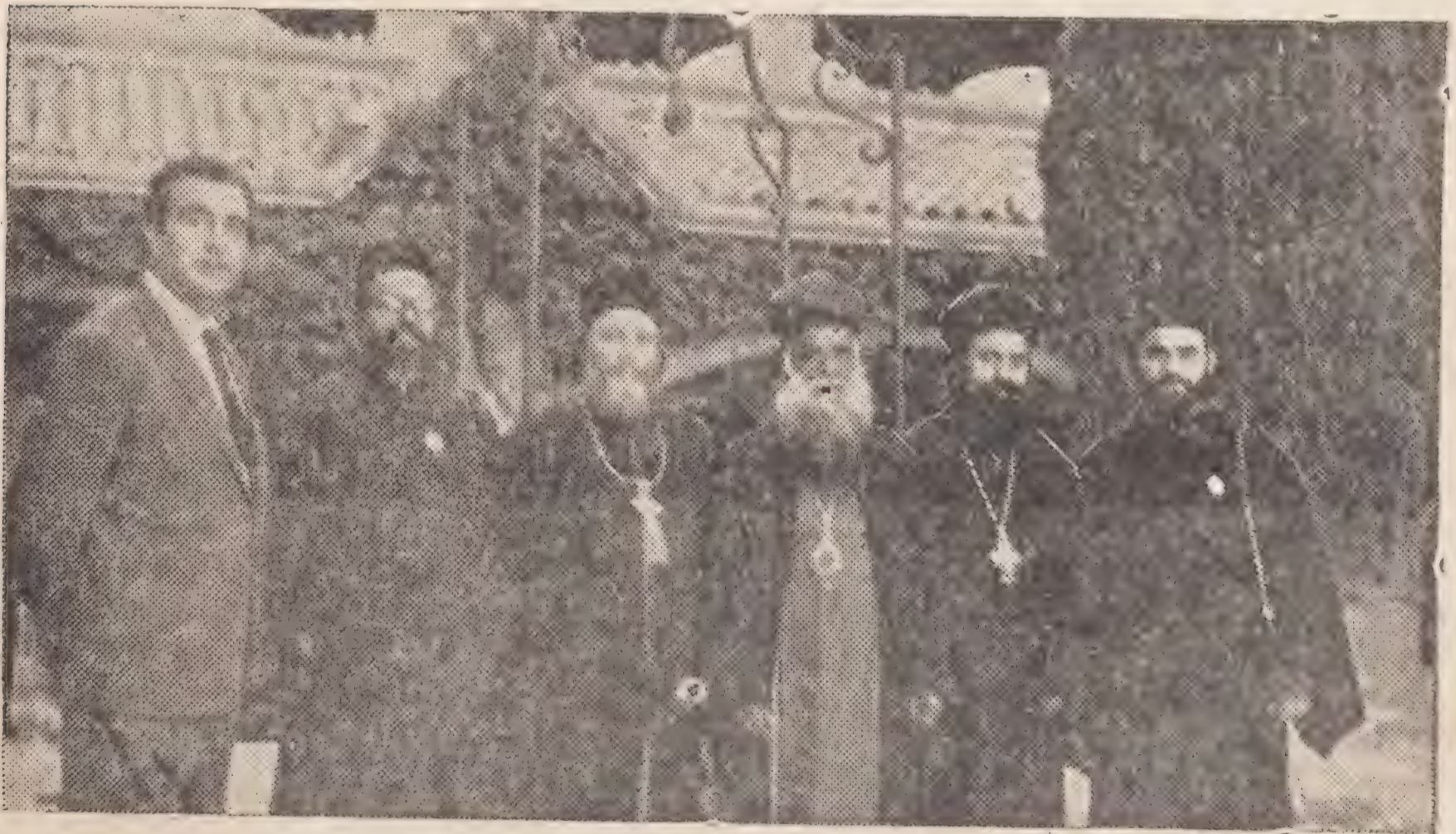
മെത്രാപ്പോലീത്തമാരുടെ സാന്നിദ്ധ്യത്തിൽ പ്രതിനിധികൾ വലത്തനിൽ 1. പരിശുദ്ധ പാത്രീയർക്കീസ് ബാവാ തിരുമനസ്സിലെ പ്രൈംറാൾ സെക്രട്ടറി സാലിബാ റെഗ്ലർ, 2. റോംസിലെ മാർ മിലിത്തോസ് ബർണാബാതിരുമേനി, 3. റോം യെൽ മാർ ചിലക്സിനോസ് തിരുമേനി, 4. മൂസലിലെ പാലൂസ് മാർ ഗ്രിഗോറിയോസ് തിരുമേനി, 5. റാദർ കെ. ചിലിപ്പോസ്, 6. കോജാ തോമ്മാ തുറി.