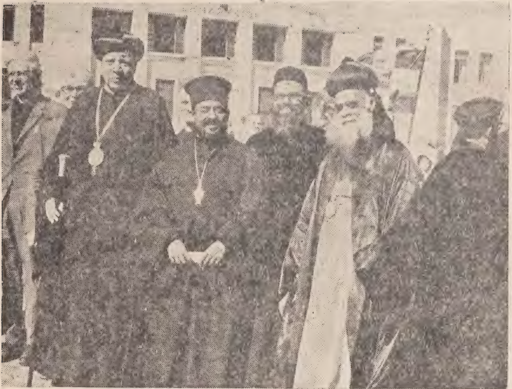
നൂറു സഭാപ്രതിനിധികൾ കോപറിക്കു എത്യോപ്യൻ പ്രതിനിധികളുമായിച്ചു